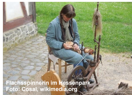
Flachspinnerin im Hessenpark

Die aufgeführten Leistungen verstehen sich vorbehaltlich der Verfügbarkeit.